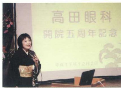
高田眼科の五年間の歩みをスライドショーで上映しました。