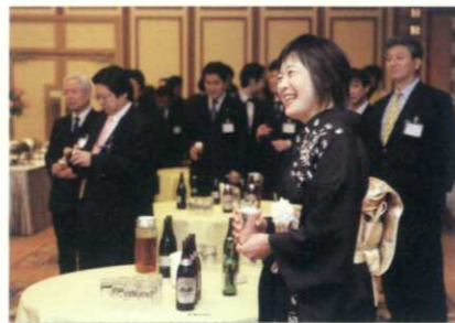
会場はとても和やかな雰囲気、あいさつでは緊張していた(?)院長も笑みがこぼれていました。