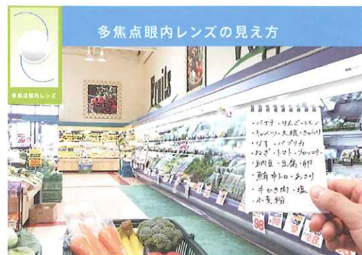
多焦点 遠くも近くも見える