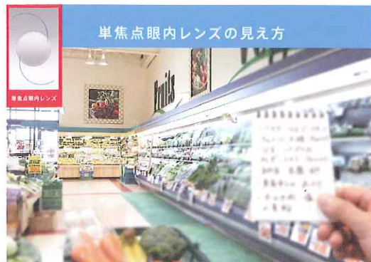
単焦点 遠くが見える (例)