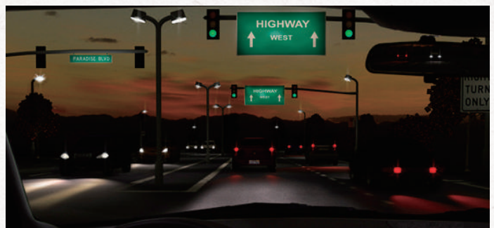
MINI WELL READY 夜間の見え方